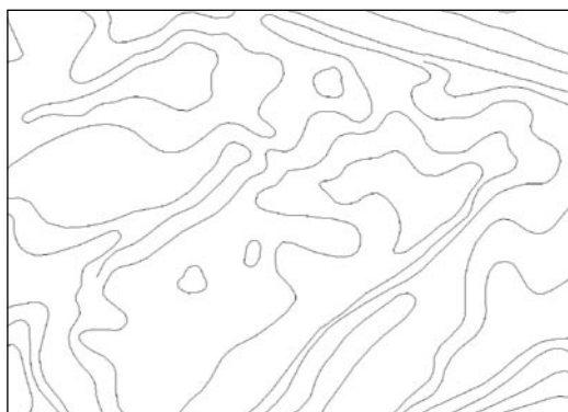
6. ábra. A csípőszúnyogok tenyészőhely-típusának (vízállásos gyepek) megjelenése szintvonal adatbázis részletén

mazása a csípőszúnyog-tenyészőhelyek térképezéséhez ígéretesnek látszik, a nagy költségigény és egyéb tényezők miatt azonban még tesztelni kell az ez irányú felhasználás lehetőségét.