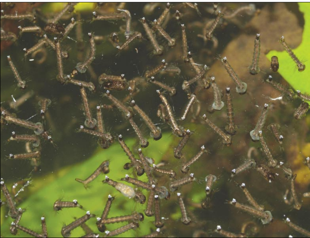
1. ábra. A gyöttrő szúnyog lárvái ártéri vízállásban

Mindkét nem egyedei táplálkoznak növényi nedvekkel, de a legtöbb fajnál a nőténynek a sikeres tojáséréshez a vér proteintartalmára is szüksége van. A csáp számos széndioxid-, tejsav-, oktenol-, acetonsav- és fenol-receptort tartalmaz. Ez komoly segítség a táplálékforrások felderítésében. A tájékozódás pontosságáról sokat mond, hogy a széndioxidot már 0,01 százalék koncentrációban is érzékeli, a hőmérséklet-változások észlelésének alsó határa pedig 0,2 °C. A vérszívást a nyál alvadásgátló hatása is segíti. A nagyobb testű fajok 6 µl, a kisebb testűek 3,7 µl vért képesek testükben elraktározni. A vérszívás alapján megkülönböztetünk madarak vérevel (ornitofil), emberek (antropofil), illetve emlősök (mammalofil), valamint más gerincesek, többnyire kétéltűek (zoofil)