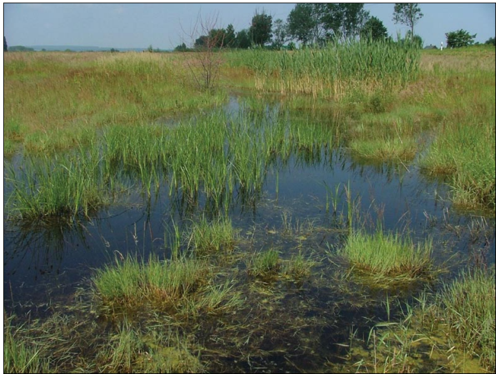
3. ábra. A balatoni berekmaradványok főképp a kora nyári időszakban fontos csípőszúnyog-tenyészőhelyek

A biológia csípőszúnyog-gyérítések terén jelentős sikereket értek el Európa egyes területein (például Rajna mentén). Az elmúlt évtizedben már Magyarországon is adottak a technológiai feltételek ahhoz, hogy a BTI-kezeléseket széleskörűen alkalmazhassák. Ezzel egyidejűleg újabb igények fogalmazódtak meg: a gyérítés legyen költségtakarékos, a térképezési munka pedig gyors és pontos. Egyértelmű, hogy ezt csak az alapos terepmunkát és a távérzékeléssel gyűjtött adatok alkalmazását ötvöző módszerrel lehet elérni.