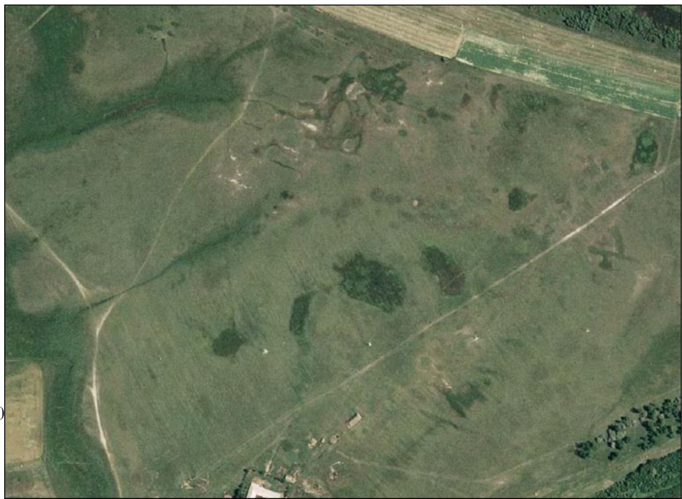
5. ábra. Csípőszúnyogok tenyészőhely-típusának (vízállásos gyepek) megjelenése RGB légi fotón

A multispektrális űrfelvételek (azonos időben több, keskenyebb spektrumban történik a rögzítés) közül a csípőszúnyog-tenyészőhelyek térképezéséhez térbeli és színképi szempontból is az IKONOS műhold ké-