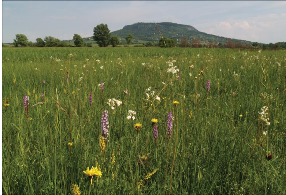
2. ábra. A láprétek időszakos vízállásaiban (különösen tavasszal) nagy tömegben fejlődnek csípőszúnyoglárva

vérevel táplálkozó csípőszúnyogfajokat. A leggyakoribb antropofil fajok a már említett gyötrő, oldal-foltos, balatoni és erdei szúnyog mellett a mocsári ( Coquillettidia richiardii , 4. ábra), a foltos ( Culex modestus ), a vöröshátú ( Aedes cinereus ) és az aranyló ( Ochlerotatus caspius ) szúnyog.