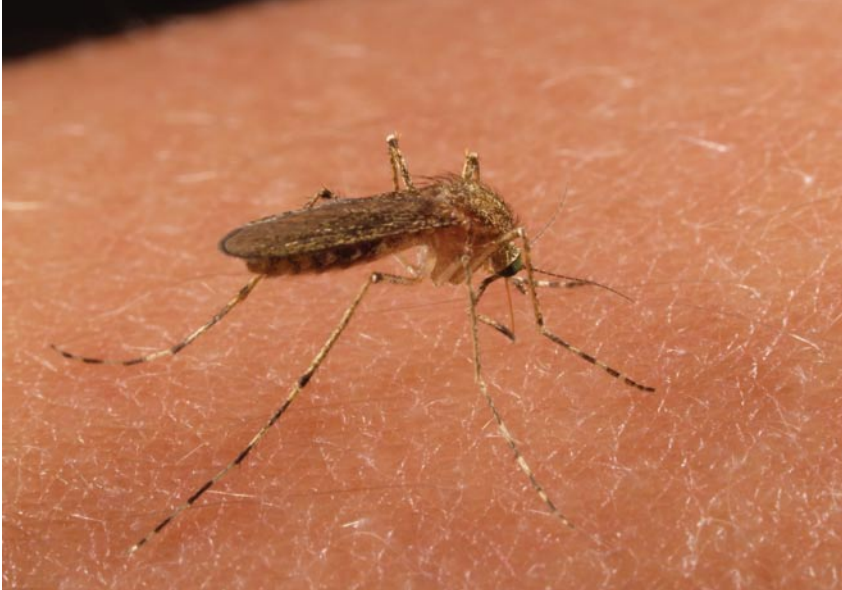
4. ábra. A mocsári szúnyog nősténye